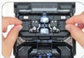
Simultaneous Fiber Loading